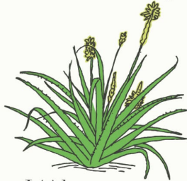
L'Aloe vera Sa tige contient un gel qui apaise les brûlures.