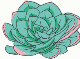
Plantes succulentes Elles stockent de l'eau dans leurs feuilles, leurs tiges ou leurs racines.